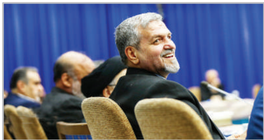
نشست فعالان سیاسی با رئیس‌جمهور