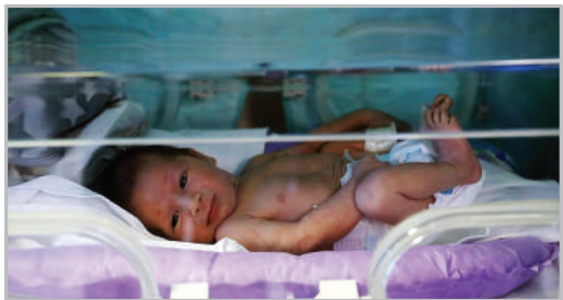
مرکز درمان نابالوری بیمارستان نجفیه