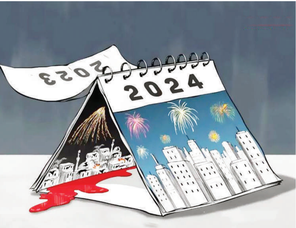
نیمی ۲۰۲۳ در غزه از تپش افتاد