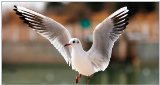
مرغان دریایی مهمانان زمستانی شیراز