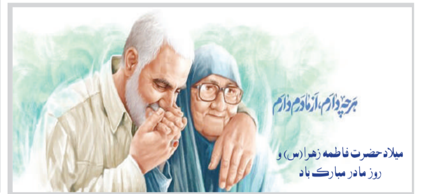
میلاذ حضرت فاطمه زهرا(س) و روز مادر مبارک باد

جلسه شورای مدیران شهرداری شیراز با حضور آیت‌الله... لطف‌الله... نماینده ولی فقیه در فارس و امام جمعه شیراز، شهردار این کلان‌شهر، مجموعه مدیریت شهری، رئیس و جمعی از اعضای شورا برگزار شد. آیت‌الله... دوکام در این جلسه ضمن تقدیر از شورای