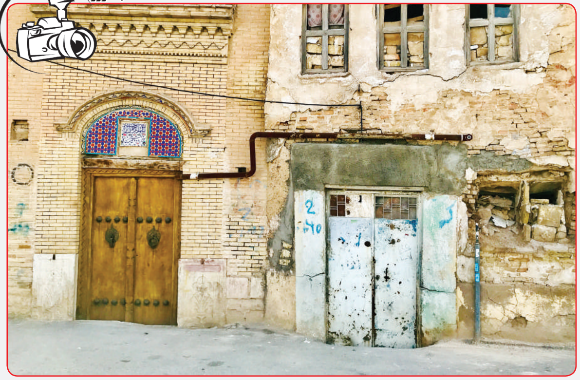
بافت قدیمی شیراز