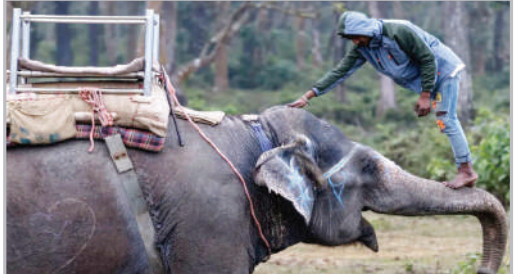
سوار شدن بر فیل در پارک ملی چیچون - نپال